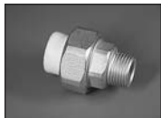
Муфта комб. разъемная (нар. резьба)