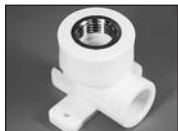
Угольник комб. с крепл. (внутр. рез.)