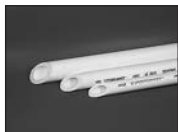
Труба PN10 для холодной воды