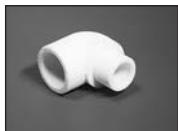
Угольник 90 град. внутр/наруж