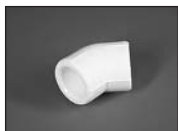
Угольник 45 град.