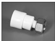
Муфта с накидной гайкой (металл.)