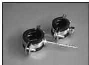
Хомут металл.с резин. прокладкой