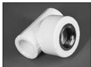
Тройник комбинированный (внутр. резьба)