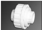
Муфта разъемная из PPRC