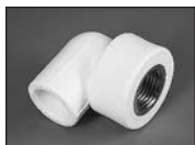
Угольник комбиниров. (внутр. резьба)