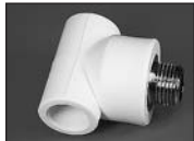
Тройник комбинированный (наруж. резьба)