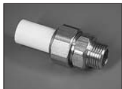
Муфта комбинир. разъемная с силиконовым уплотнителем (наружн. резьба)