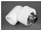
Угольник комбиниров. (наруж. резьба)