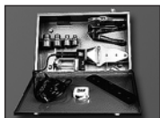
Комплект сварочного оборудования