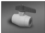
Кран шаровой PPRC