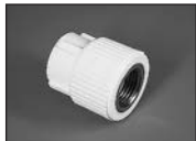
Муфта комбинированная (внутр. резьба)