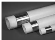
Труба PN25 армированная