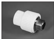
Муфта комбинированная (наруж. резьба)