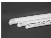
Труба PN20 для горячей воды