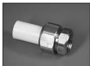
Муфта комбинир. разъемная с силиконовым уплотнителем (внутр. резьба)