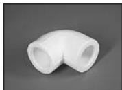
Угольник 90 град.